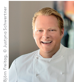
Björn Freitag

Gemeinsam mit Sterne-Koch Björn Freitag zeigt die Klimaschutzagentur Weserbergland, wie einfach klimafreundliches Kochen ist. Verschiedene vegetarische Gerichte und schmackhafte Leckerbissen mit hauptsächlich regionalen und saisonalen Produkten aus dem Weserbergland werden live zubereitet